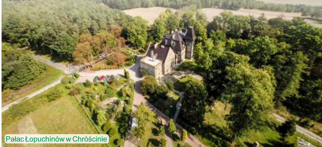
Pałac Łopuchinów w Chróście