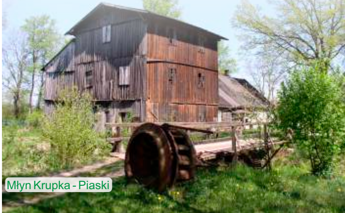
Młyn Krupka - Piaski

Współcześnie młyn otoczony jest wspaniałą przyrodą. Jednak na budynku zaznaczyły się z widoczne oznaki przemijania czasu. Całkowicie znikła przybudówka mieszcząca turbinę wodną. Jej pozostałości, wydobyte są z wody i umieszczone na lewym brzegu Młynówki, tuż przy dawnym moście - skłaniają do refleksji. Opuszczając teren warto zwrócić uwagę na drewnianą, przydrożną kapliczkę, umieszczoną w pniu drzewa.