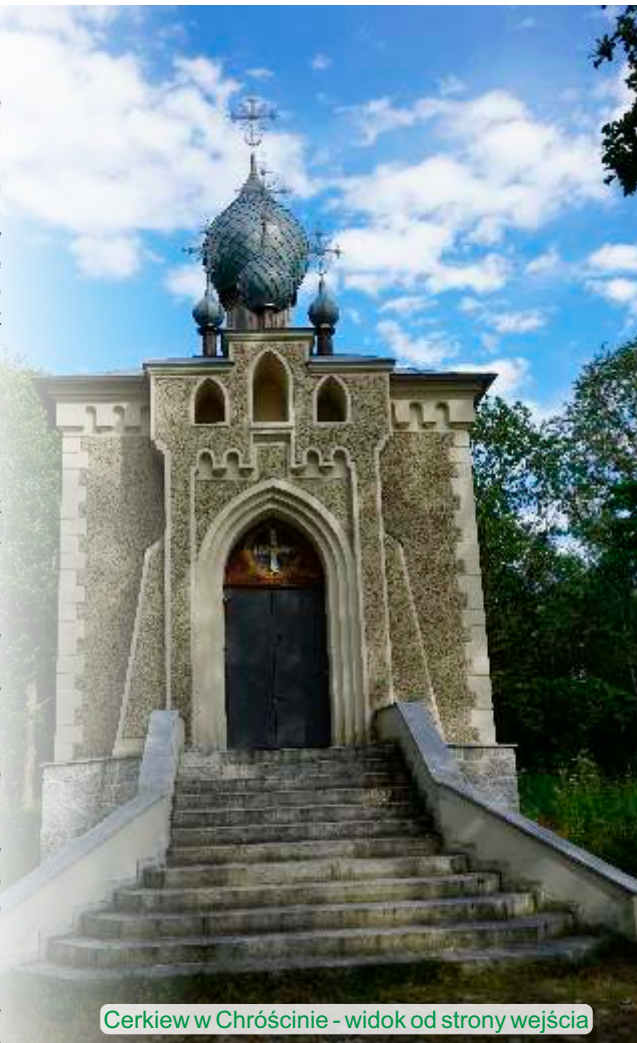
Cerkiew w Chróście - widok od strony wejścia