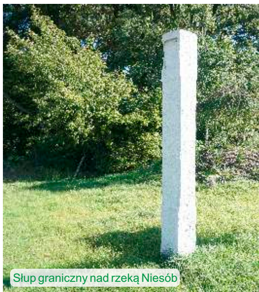
Słup graniczny nad rzeką Niesób

Jadąc z Podzamcza do Wieruszowa, po lewej stronie, 50 m przed mostem na Niesobie, tuż przy drodze znajduje się szczególny zabytek – pozostałość po czasach rozbiorowych, granitowy słup. Kiedy po Kongresie Wiedeńskim w 1815 r. Prusacy opuścili prawobrzeżny Wieruszów, granice państwowe pomiędzy Prusami i Rosją ustalano w naszym rejonie głównie na nurcie rzeki Proсны, ale w Wieruszowie wyznaczono na rzeźce Niesób, wtedy zapewne odnodze Proсны. Mimo, iż rzeka przez lata często zmieniała swe koryto, granica państwowa nie ulegała przesunięciu.