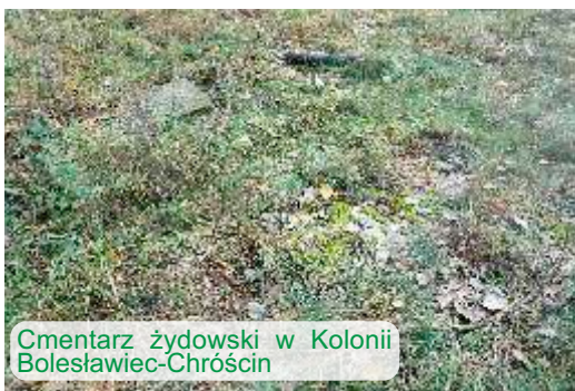
Cmentarz żydowski w Kolonii Bolesławiec-Chróście