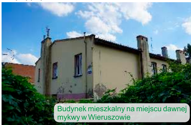
Budynek mieszkalny na miejscu dawnej mykwy w Wieruszowie

Po wkroczeniu Niemców, już 2 września 1939 r. zamordowano 21 wyznawców judaizmu. 13 października 1941 r. hitlerowcy utworzyli getto, zamykające się ulicami: Nadrzeczną, Kilińskiego i Zamkowej oraz zakolem rzeki Proсны. W sierpniu 1942 r. zlikwidowali getto, a ludność przewieźli do obozów koncentracyjnych. Niezdolnych do transportu 86 starców i chorych w nocy z 26 na 27 sierpnia 1942 r. spędzili do mykwy, gdzie ich rozstrzelano. Ciała zostały pogrzebane w zbiorowej mogile na cmentarzu żydowskim. Mykwa została spalona. Po wojnie odbudowano ją, początkowo w budynku mieściła się sekcja kajakowa klubu sportowego Proсны – Start Wieruszów, a obecnie znajdują się mieszkania komunalne.