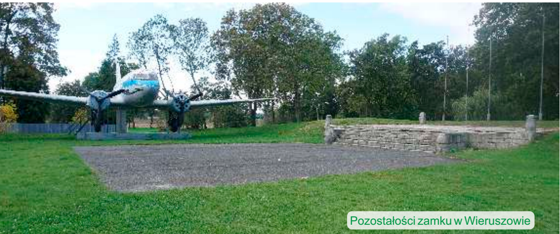
Pozostałości zamku w Wieruszowie

I wojna światowa i powstanie wielkopolskie dla zamku, to okres zniszczeń przez oddziały niemieckiego Grenzschutzu, częściowe rozebranie i wykorzystywanie cegły jako materiału budowlanego. Dopelnieniem całkowitych zniszczeń budowli była rozbiórka pozostałości ruin w latach 60-tych XX wieku.