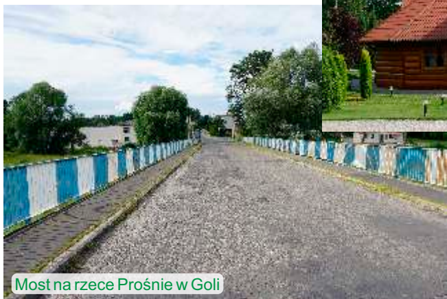
Most na rzece Prośnie w Goli