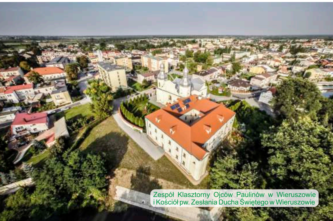
Zespół Klasztorny Ojców Paulinów w Wieruszowie i Kościół pw. Zestania Ducha Świętego w Wieruszowie